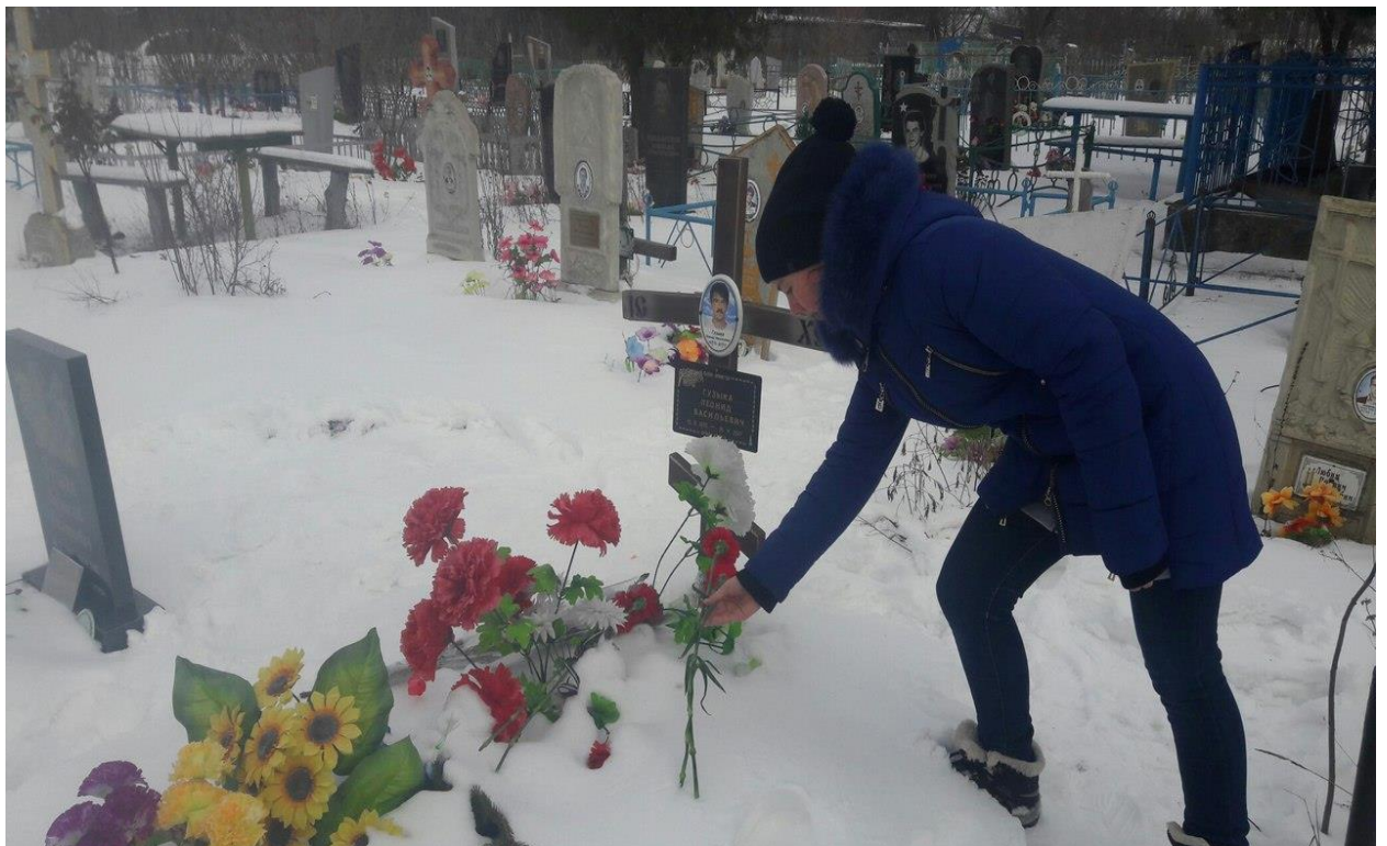
Фото 4. Акція «Вшанування пам'яті воїнам-інтернаціоналістам»