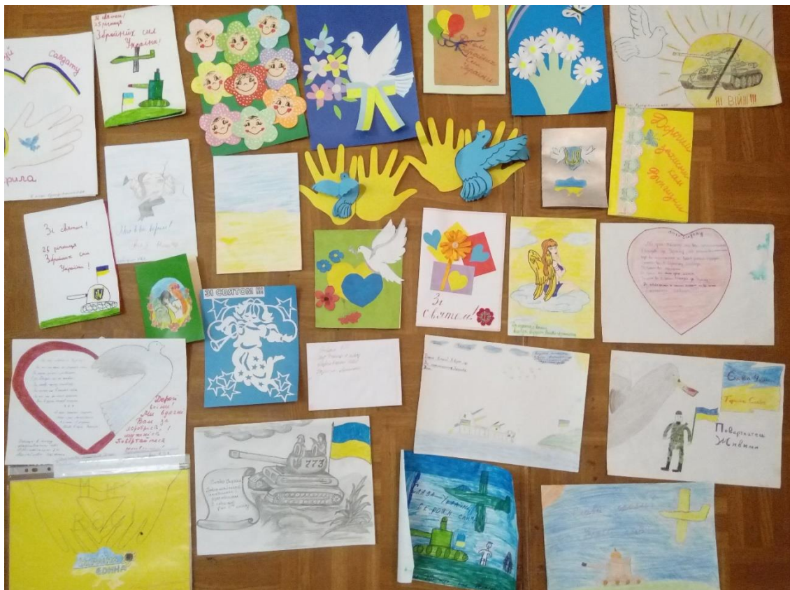
Фото 10. Акція «Напиши листа солдату»