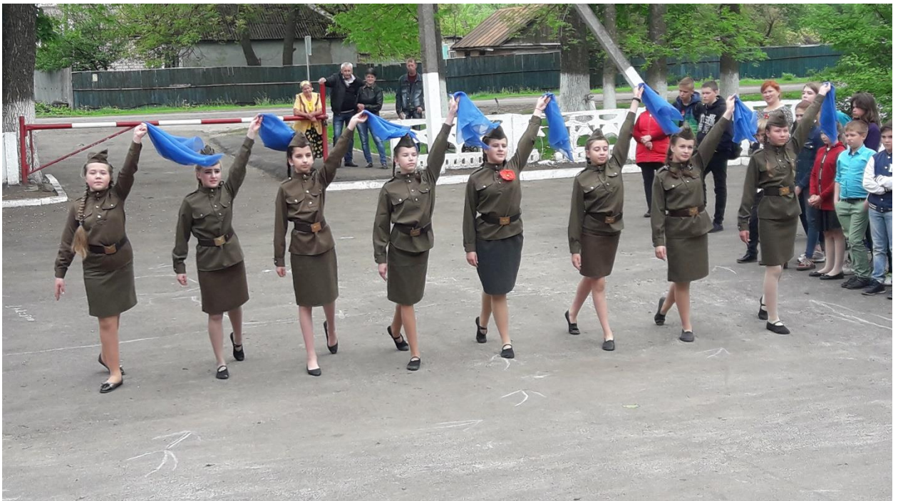
Фото 6. Акція «День пам'яті та примирення»