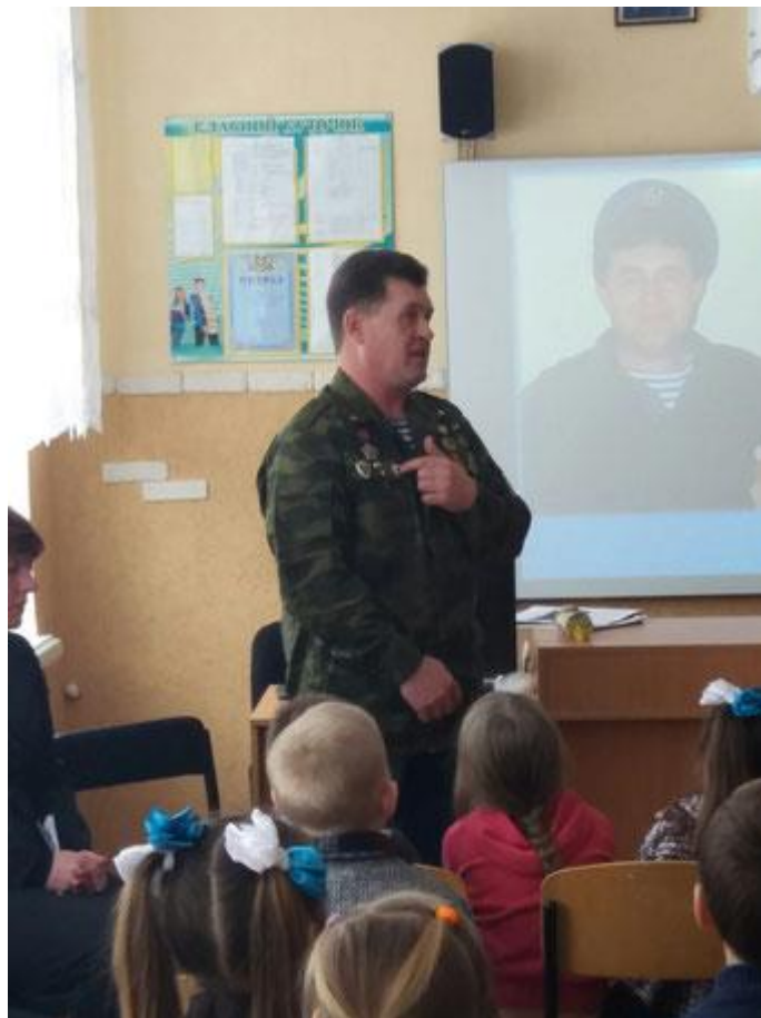
Фото 5. Зустріч учнів та привітання воїна-інтернаціоналіста «Виведення військ з Афганістану»