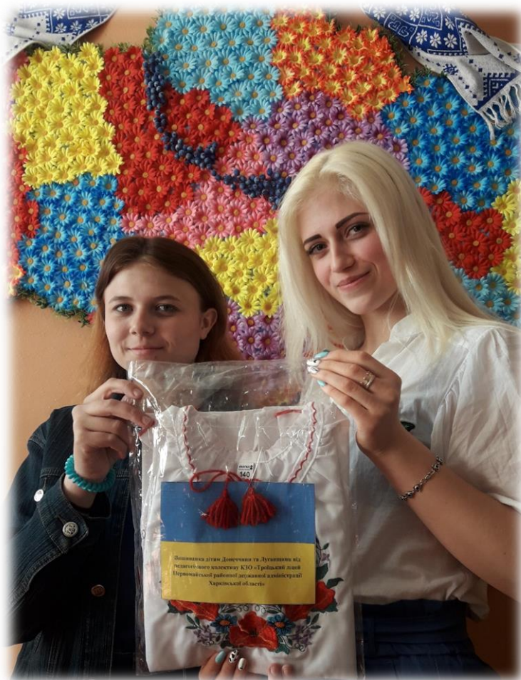
Фото 1. Благодійна акція «Вишиванка дітям АТО»