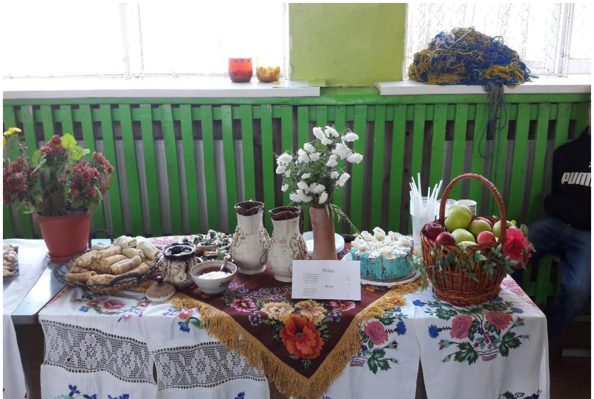
Фото 3. Благодійна акція «Осінній ярмарок єдності та солідарності»