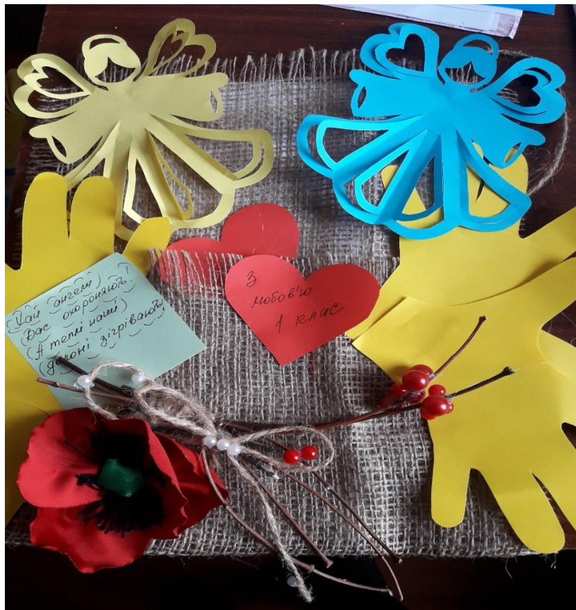
Фото 9. Акція «Оберіг для воїна АТО»