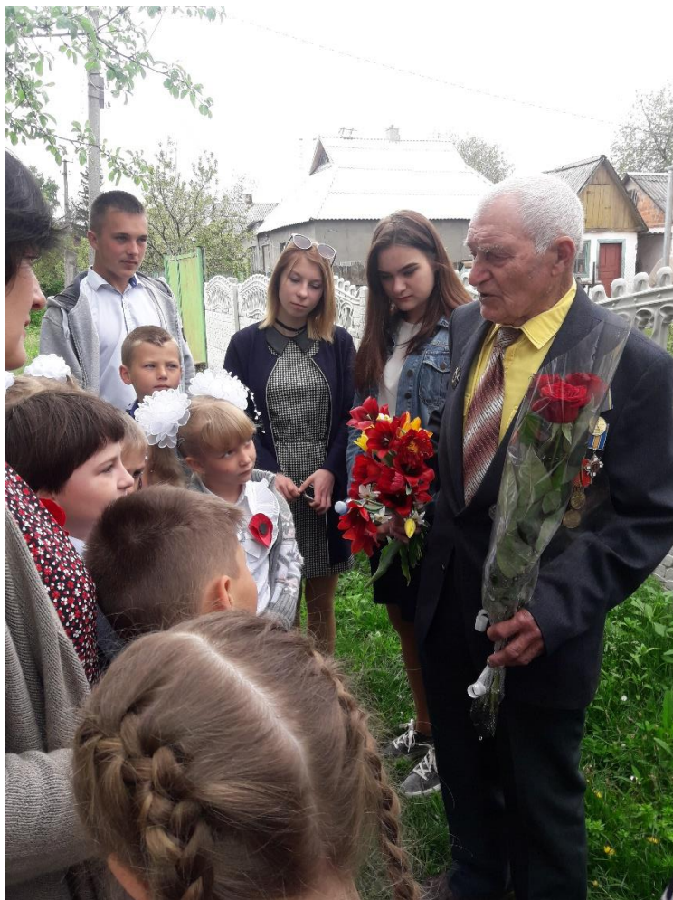
Фото 7. Акція «Привітай ветерана Другої Світової війни»